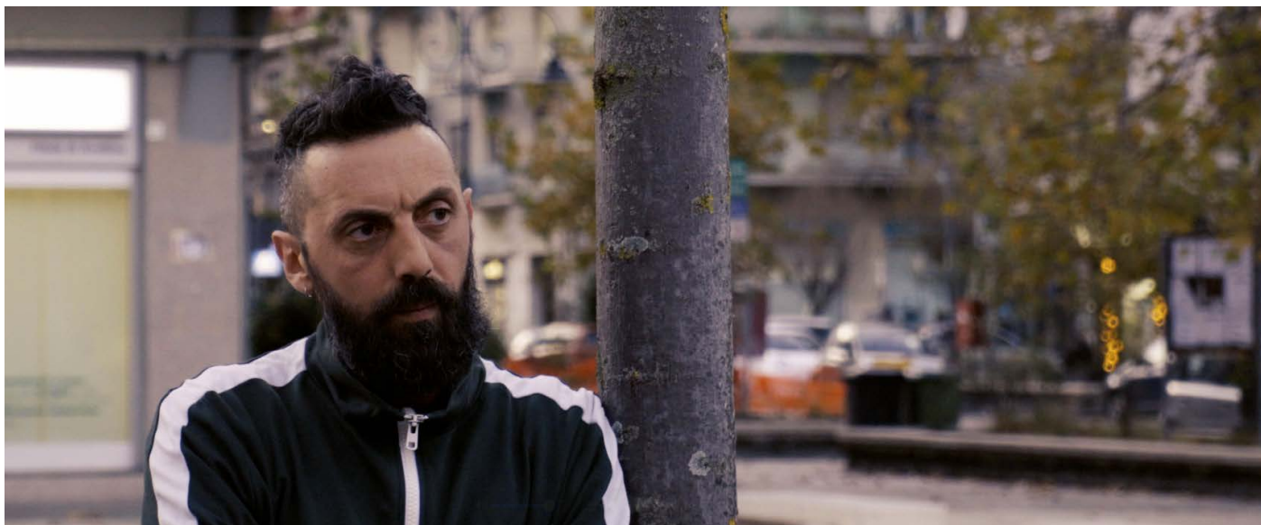
Me ne vado e divento Papa di Antonello Carbone

Terzo film in concorso è Me ne vado e divento Papa , lungometraggio d'esordio del regista irpino Antonello Carbone, autoironica riflessione sul valore delle radici e sull'ostinato attaccamento alla propria terra natale. L'ultimo lungometraggio in programma è I colori del silenzio di Francesco Di Martino e Stefano Garaffa Botta, ambientato sulle rive del fiume di risorgiva più lungo d'Europa (il Sile, in Veneto) e che esplora il fragile, ma inscindibile rapporto fra uomo e natura.