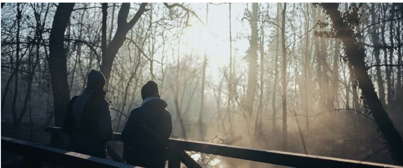
I colori del silenzio di Francesco Di Martino e Stefano Garaffa Botta