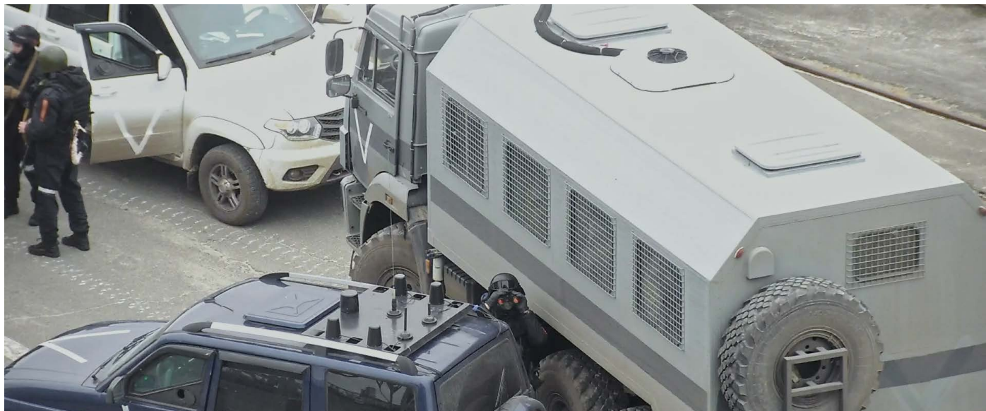
Special Operation di Oleksiy Radynski

Fra i lungometraggi in programma è previsto Special Operation di Oleksiy Radynski, documentario presentato nella sezione Forum Expanded della Berlinale e che racconta l'occupazione da parte delle truppe russe della centrale nucleare Ucraina di Chernobyl a Febbraio e Marzo 2022, grazie ai filmati di sorveglianza delle telecamere a circuito chiuso della centrale stessa.